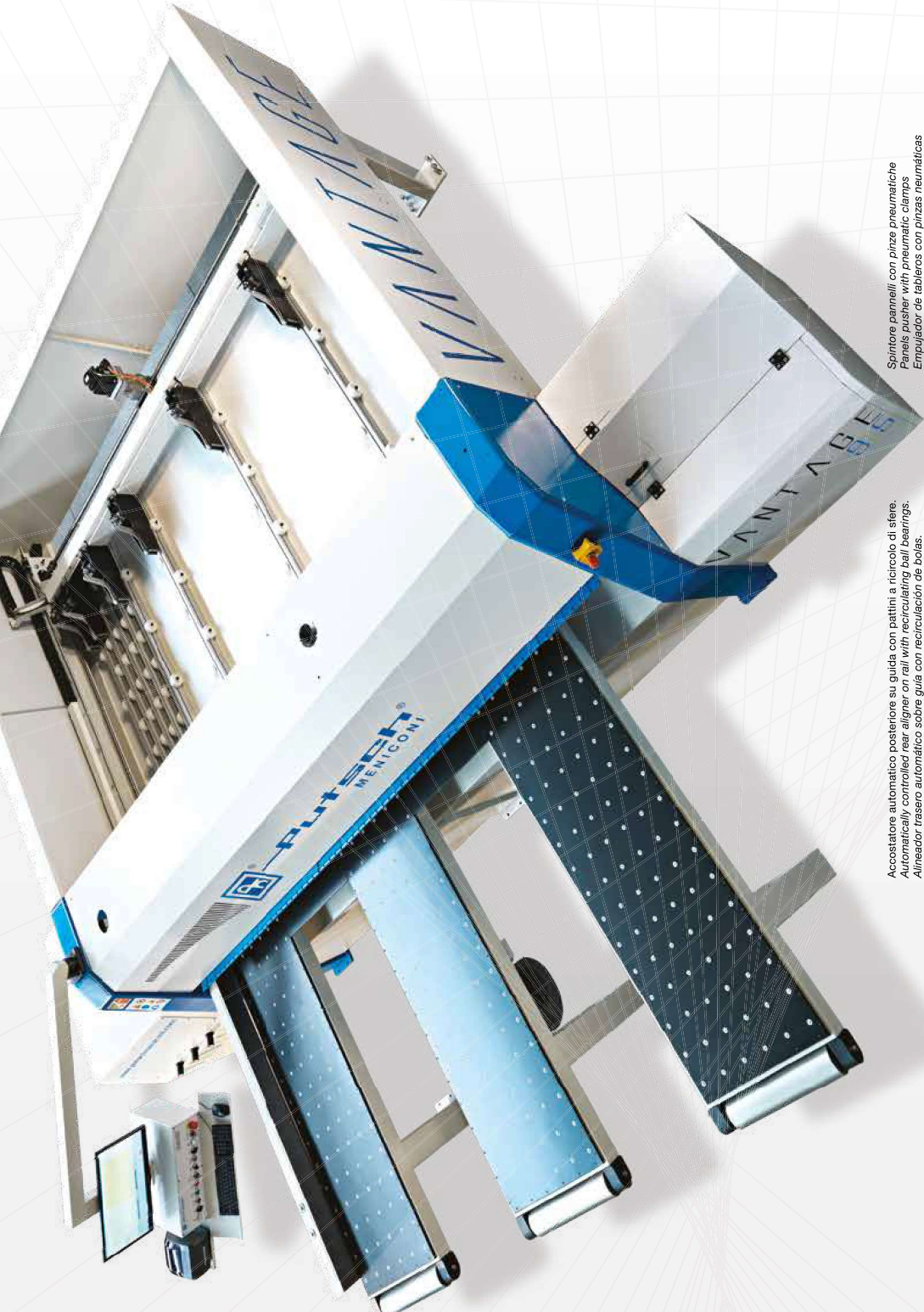
Accostatore automatico posteriore su guida con pattini a ricircolo di sfere. Automatic rear aligner on guide with recirculating ball bearings Alisador tras automático sobre guía con recirculación de bolas Automatischer hinterer Ausrichter auf Führungen mit Kugelzirkulations-Gleitblöcken Aligneur arrière automatique sur guidage à recirculation de billes.