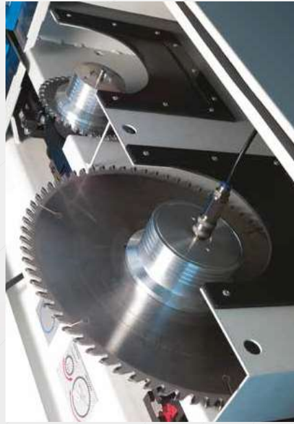
Carro-lame con cambio pneumatico degli utensili Saw carriage with pneumatic saw blades change Carro porta-hojas con cambio neumático de las sierras Sägewagen mit einfachem pneumatischem Sägeblattwechsel Chariot porte-lames avec changement pneumatique des lames