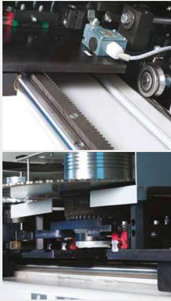
Salita lame indipendenti su guide con pattini a ricircolo di sfere. Movement and positioning by racks and pinions with sensor and magnetic strip Desplazamiento y posicionamiento con cremalleras y pñones de movimiento a través de sensor y banda Bewegung mit Ritzel und Zahnstangen und Positionierung durch Sensor und Magnetband Mouvement et positionnement avec pignon et crémaillère au moyen du capteur et bande magnétique