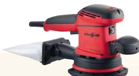
EVA 150 E / 3