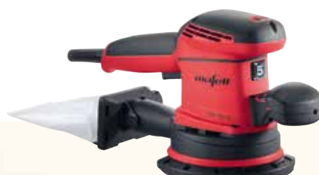
EVA 150 E / 5