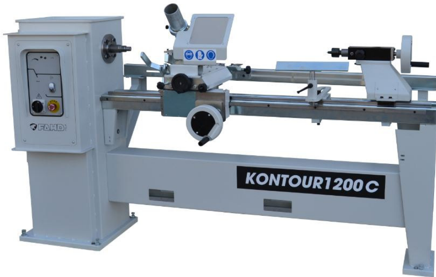
KONTOUR 1200C – avec copieur manuel