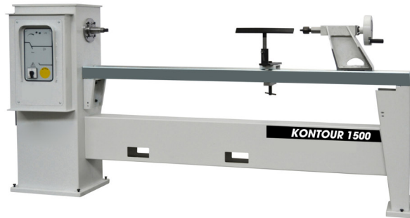
KONTOUR 1500 – sans copieur