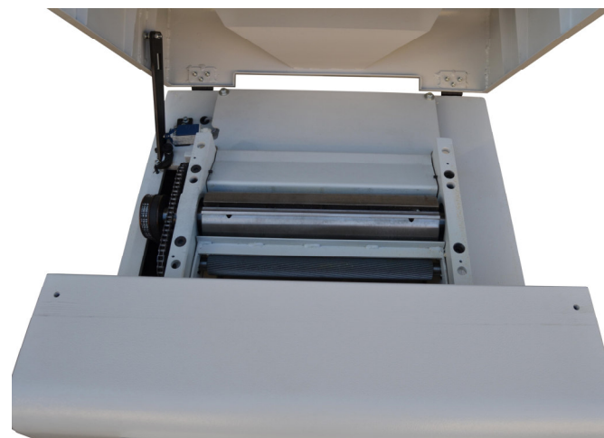
SP 400 KLASS