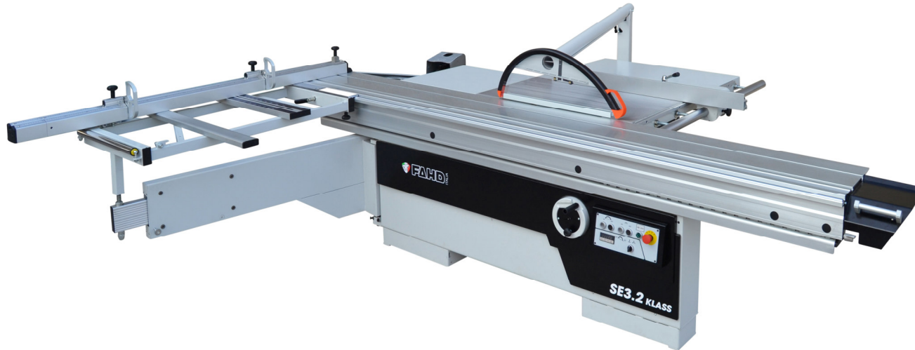
SE3.2 KLASS avec soulèvement lame motorisé (opt)