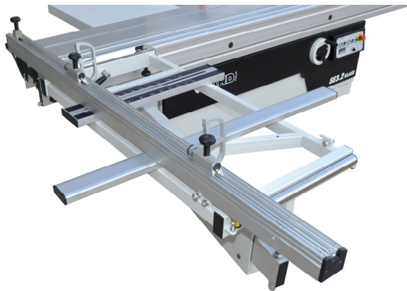
goniomètre avec guide inclinable