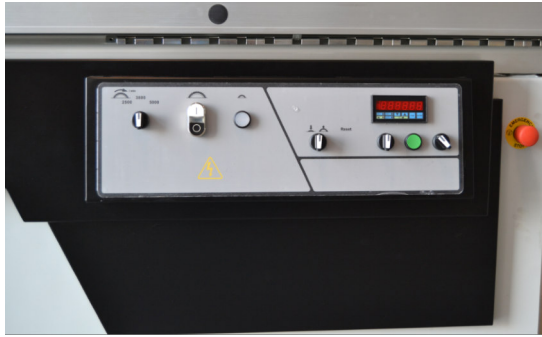
Soulèvement lame motorisé Inclinaison lame motorisé avec positionneur