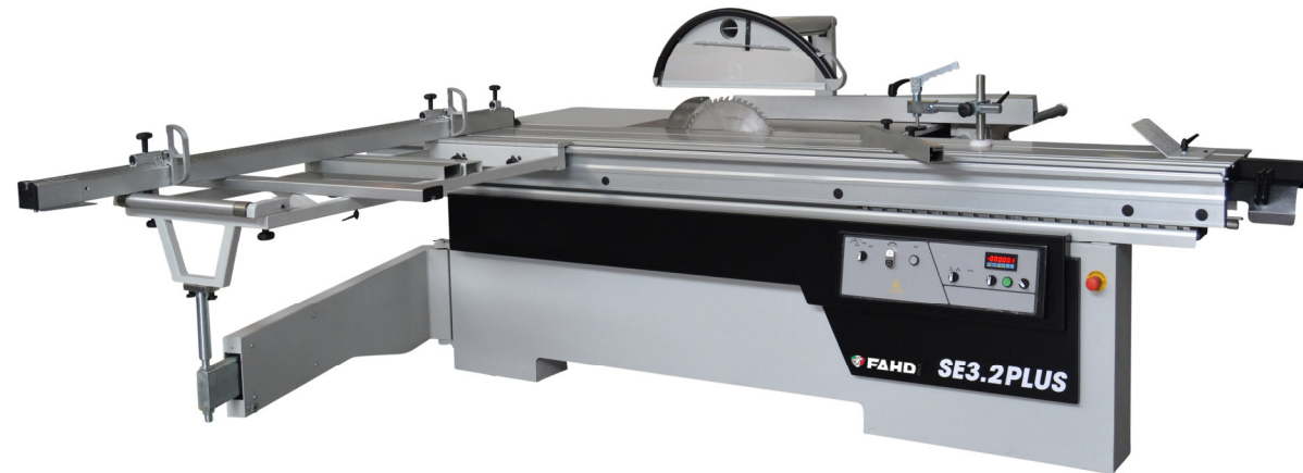
SE 3.2 PLUS avec soulèvement lame motorisé et Inclinaison lame motorisé avec positionneur – opt.