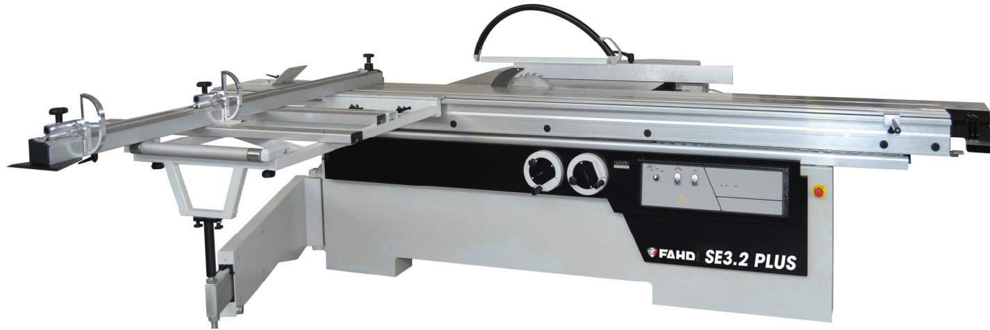
SE 3.2 PLUS