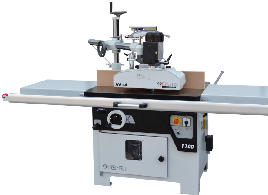
Version avec plans allongés