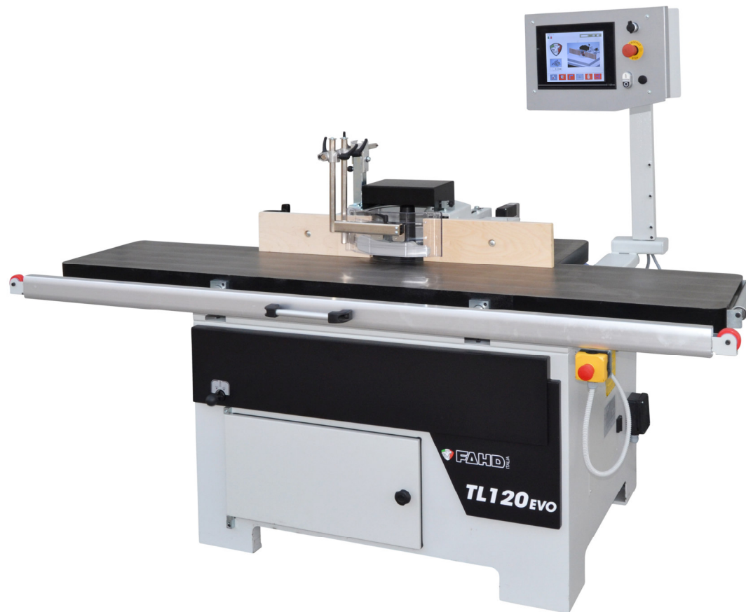
TL 120 EVO – avec guides toupie à 2 axes gérés par le panneau de commande