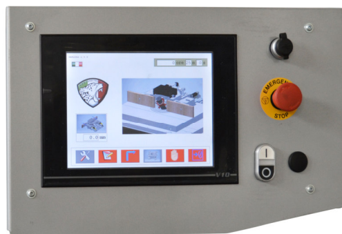
Panneau de commande 10" (optional)