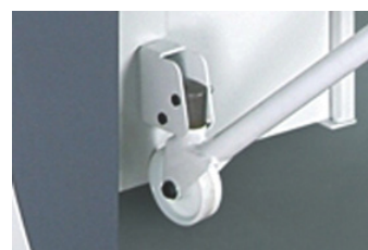
Wielset voor het verplaatsen van de machine. Wheel set to easily move the machine. Kit de déplacement.

Detail verkoper Detail seller Distributeur