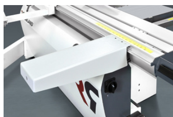
Extra steunafel Additional support table Table de support supplémentaire