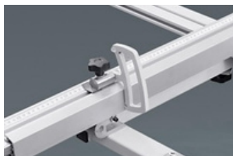
Extra Z3 flipper-stop additional Z3 flipper stop Butée additionnelle type Z3