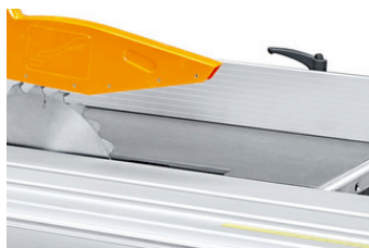
Voorritszaag, begrenst bij gebruik de hoofdzaag tot Ø 250 mm Scoring saw, limits the main saw to Ø 250 mm when in use Inciseur, limite la scie principale à Ø 250 mm lors de son utilisation