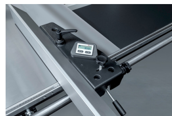
Digitale uitlezing op de parallelgeleider type Z3 Digital readout on the parallel fence type Z3 Affichage numérique sur le guide parallèle type Z3