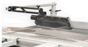
Overhangende zaagkap Overhanging Saw guard Protection de scie en surplomb