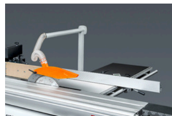
Overhangende stofafzuiging Ø 100 mm op het spouwmes Dust extraction tube Ø 100 mm on the riving knife Tube d'extraction Ø 100 mm monté sur le couteau diviseur