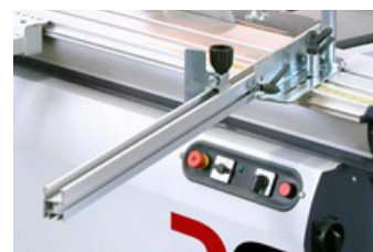
Schuinstelbare afkortgeleider zonder houtklem. Mitre fence without wood clamp. Guide d'onglet sans presseur excentrique.